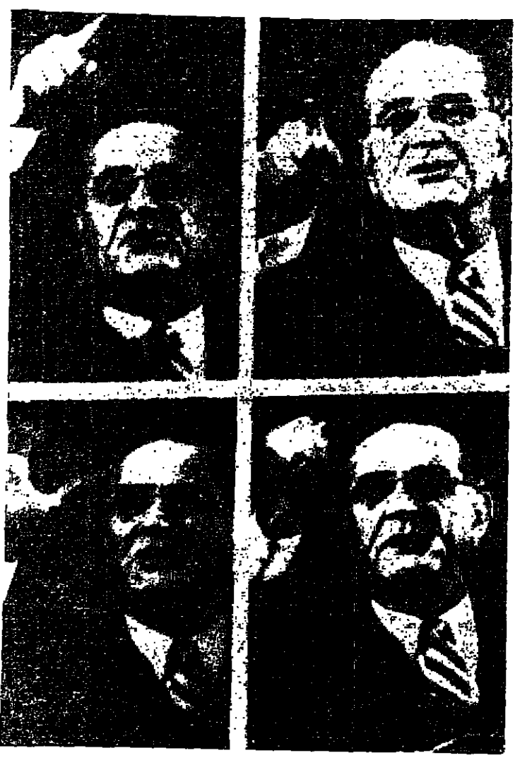
صورة لاسكيتة خاصة من اليونانيد برس للمستور نجل الرئيس الأمريكي ليندون جونسون وهو يلقي خطبه في منظمة بناي بريت اليهودية - ويرى جونسون في الصور الأربع وهو يحرك يديه بصورة غير معتادة للتأكيد على بعض فقرات خطبه

وقال جونسون إن الولايات المتحدة ستدعم أي جهد يهدف إلى تحقيق السلام في الشرق الأوسط. وأضاف أن الولايات المتحدة ستدعم أي جهد يهدف إلى تحقيق السلام في الشرق الأوسط.